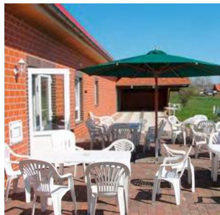
Der sonnige Freisitz mit der Freiluftkegelbahn

Als Beispiel sei nur die Bewirtschaftung des Hauses angeführt: rund 50 ehrenamtliche Helfer, stellen die Bewirtschaftung des Hauses an jedem Wochentag im Jahr sicher und sprechen ihre Zuständigkeiten untereinander ab. Aus all diesen Gegebenheiten ist auch das Verantwortungsgefühl für das Haus sowie das Wir-Gefühl für die Dorfgemeinschaft gewachsen und macht sich immer wieder positiv bemerkbar - nicht nur bei den Älteren sondern auch bei den Jugendlichen und den jungen Erwachsenen.